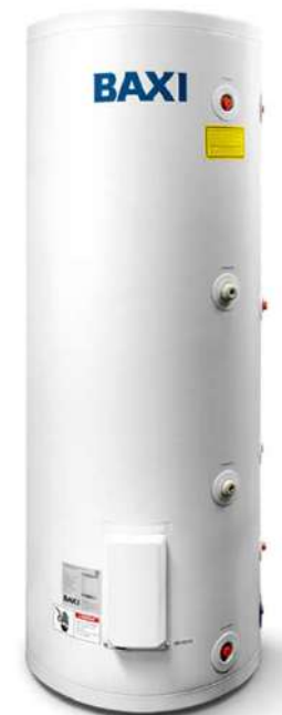
UBC DC 200/300/400/500