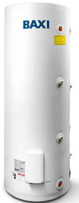
UBC 100/200/250 /300/400/500